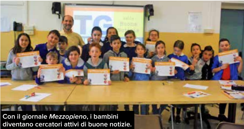
Con il giornale Mezzopieno , i bambini diventano cercatori attivi di buone notizie.